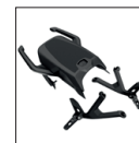
5 Mitfahrersitz (219401216)